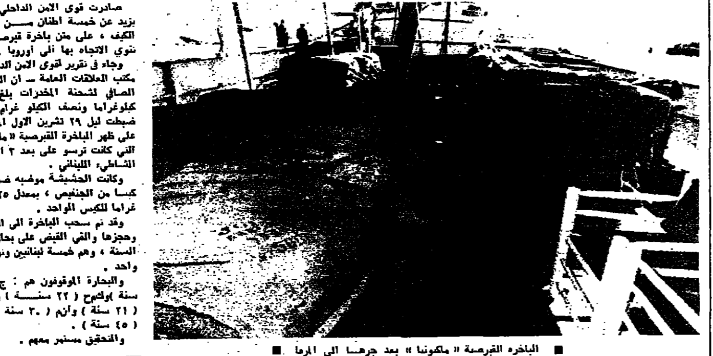
البخار القرمصة «مكونا» بعد جرها الى الرما